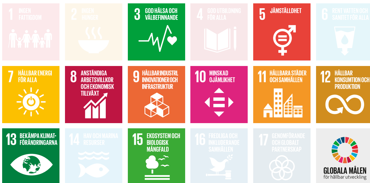
FN:s mål för hållbar utveckling

2015 investerade Finja i grön el och byggde två vindkraftverk, placerade på Rödsthöjden utanför Sollefteå. Vindkraftverken genererar tillsammans nästan 20 GWh förnybar energi. Detta är dubbelt så mycket som våra bolag för närvarande använder.